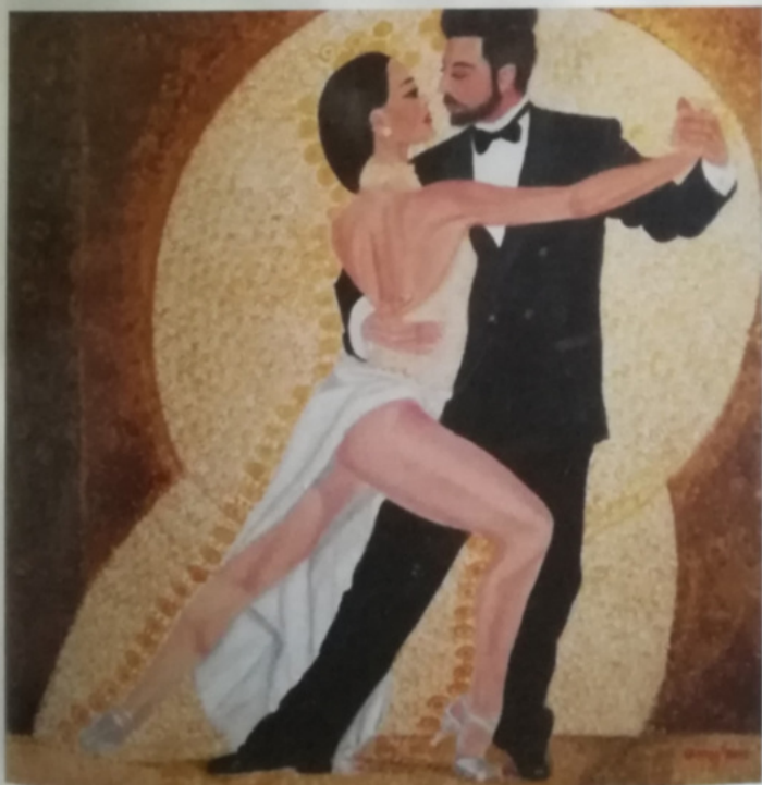
Tango argentino, 2017, acrilico su tela 100 x 100 cm.

dalla musica, alimentata dalla eleganza delle forme danzanti. Spiragli spirituali e fremiti che sono colti nelle zone più intime da un'artista che li traduce sulla tela con i suoi stati emotivi, i suoi piaceri e le sue speranze. Tutti elementi che l'osservatore sente, quasi inconsapevolmente, e ringrazia Caroggi per quegli attimi di felicità che ha saputo donare con la sua pittura. Rientra nei suoi compiti e nelle sue possibilità, quale pittrice, quello di interpretare necessità e stati d'animo, desideri e doveri di una umanità che nello smarrimento può trovare luce nell'arte, l'arte di Caroggi al secolo Carmen Oggianu.