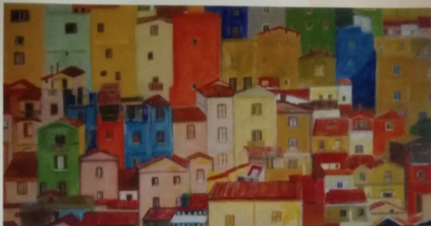
I Colori di Bosa, 2015, acrilico su tela 80 x 40h cm

raggiunto in queste opere. La musica, il paese Bosa, fanno parte di una umanità in cui anche lo spettatore si sente parte, vuole farne parte, vuol essere presente e godere di quel momento paradisiaco che la visione di Caroggi ci presenta con un fascino irresistibile che solo l'arte sa dare. Ci sono poi delle raffinatezze da notare. Le nature morte con i loro colori posti su un vetro che sempre si rispecchiano in duplici forme e colori. Ed ancora, non la grande metropoli con la sua aria carica di anidride carbonica, ma una raccolta di case variopinte, strettamente poste una vicino all'altra, in una graziosa disarmonia architettonica, necessaria a sottolineare l'unione, la vicinanza, la familiarità e l'affetto di tutti e a immaginare la necessità di un vivere di gioioso equilibrio, sorretto dalla sinfonia della natura,