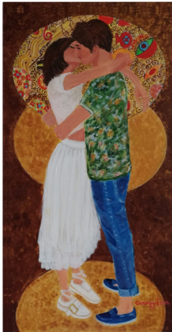
"Il Bacio" - 2019 - Acrilico su tela - cm 80 x 40

I due dipinti rappresentano l'amore nascente fra due giovani, simile ad una rosa che sboccia ed emana il suo profumo tutt'intorno. "L'amour!" ritrae i loro corpi teneramente abbracciati, con i volti molto vicini fra loro, quasi volessero baciarsi, circondati da una luce celestiale e da un simbolico cuore, dal quale scaturisce la dolce melodia in cui si sentono immersi. Mentre "Il Bacio" coglie l'istante in cui i due giovani manifestano con un bacio romantico il loro amore, in una esperienza sempre nuova e antica. I loro volti sono illuminati da una luce variopinta con disegni floreali e musicali, che mette in risalto la gioia che essi provano nello stare insieme. Un secondo riflettore mette in evidenza i loro giovani corpi nell'atteggiamento di un delicato e affettuoso abbraccio, mentre i loro piedi sono illuminati da un simbolico piedistallo, che indica il completo isolamento della coppia dall'ambiente circostante.