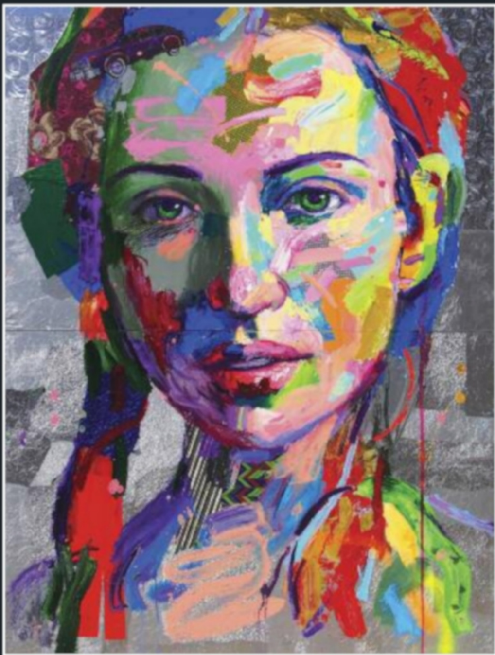
"FIRE AND ICE" - cm 160 x 120