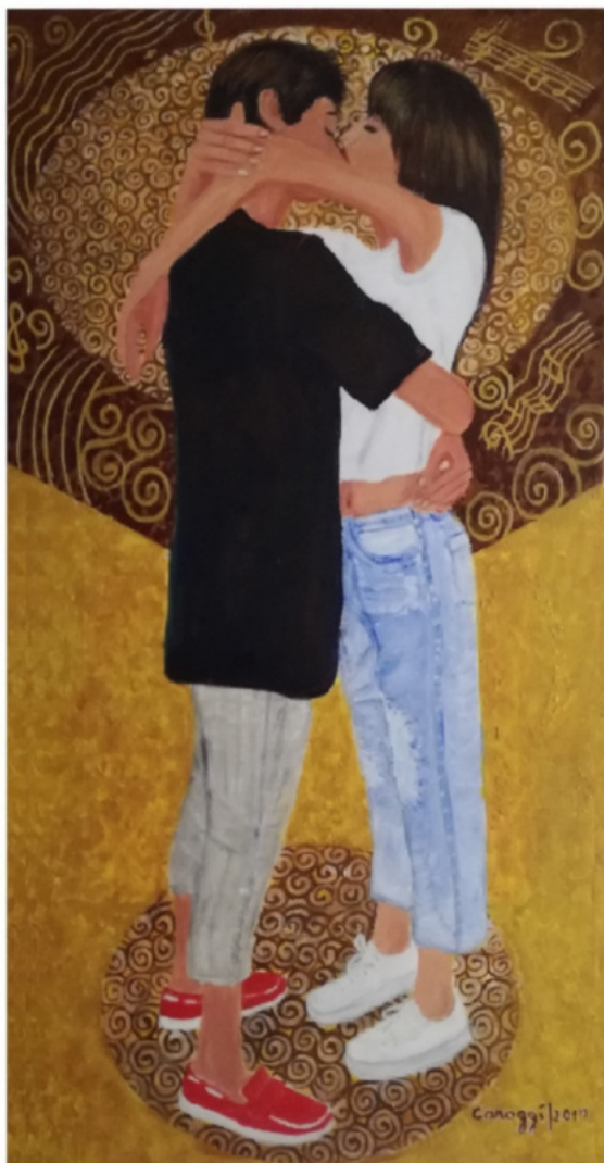
"L'amour!" - 2019 - Acrilico su tela - cm 80 x 40