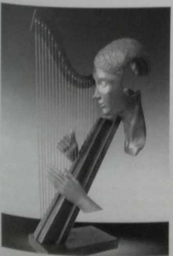
Oliveri, Arpa , 2019, fusione in bronzo a cera persa 43 x 87 x 28 cm, € 13.000/A

(Francia), Atelier Alessandro Coralli; Kotschnach (Austria), Artist.