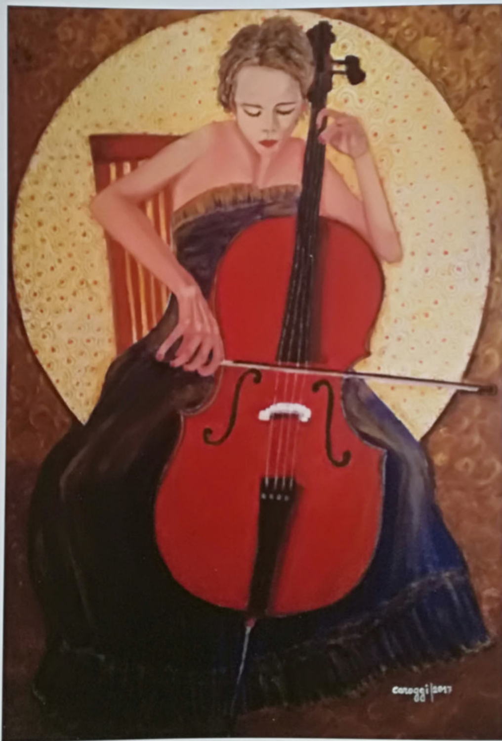
Carmela Oggianu (in arte Caroggi), Saggio di violoncello , 2017, acrilico su tela Gallery 70 x 100 cm