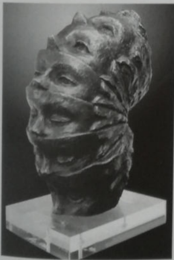
Oliveri, Genio plurimo , 2019, fusione in bronzo a cera persa 23 x 40 x 18 cm, € 6.500/A

REFERENZE: Orta S. Giulio, Ortarte; Dolceacqua, Eroxo Art; Manfredonia, Il Novecento; Salerno, Re d'Italia Art; Mougins