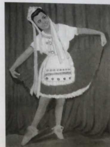
Oggianu, La ballerina , 2017, acrilico su tela 60 x 80 cm

Formazione: conseguita la laurea in Pedagogia all'Università di Cagliari, lavora come docente di musica nella scuola media per oltre un trentennio, coltivando in parallelo la sua passione per l'arte, la spiritualità e la filosofia. Dal 1987 firma