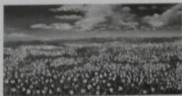
Oberti, Tuffandosi tra i fiori , 2016, olio materico spatolato su tavola 140 x 70 cm, € 2.310/A

Formazione: consegue il Diploma di geometra e si laurea in Architettura presso il Politecnico di Torino, è insegnante alle scuole medie e superiori. Soggetti: paesaggi, visioni astratte e opere informali. Tecniche: olio materico spatolato su tavola, tela, alluminio, ceramica; tecniche miste. Hanno scritto dell'artista: Belgiovine, Levi, Marasà, Perdicarò.