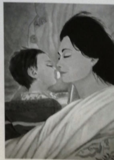
Oggianu, Il profilo della vita , 2018, acrilico su tela 50 x 70 cm, € 1.800/A

[Vedi tavola a colori fuori testo artista]