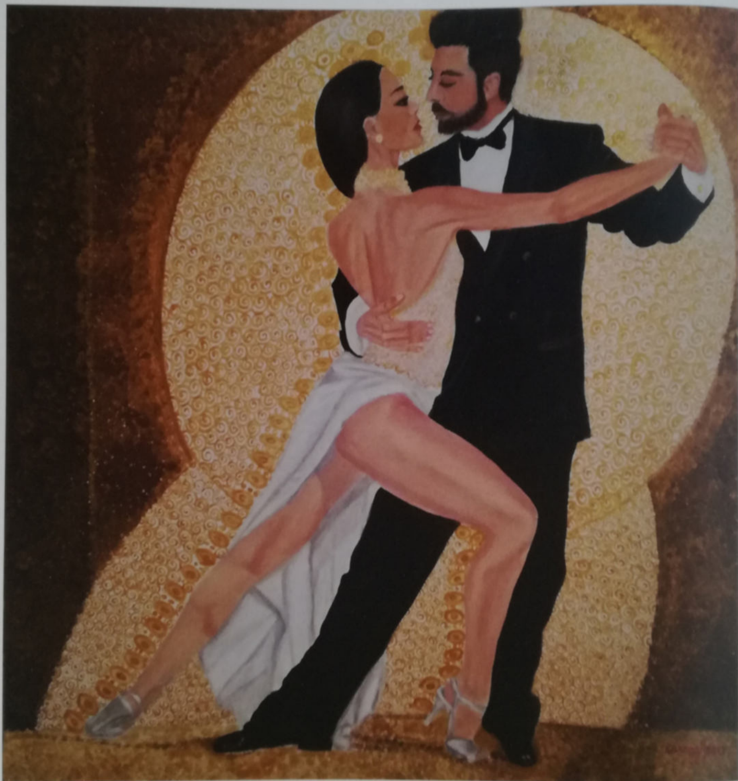
Carmela Oggianu (in arte Caroggi), Tango argentino , 2017, acrilico su tela 100 x 100 cm