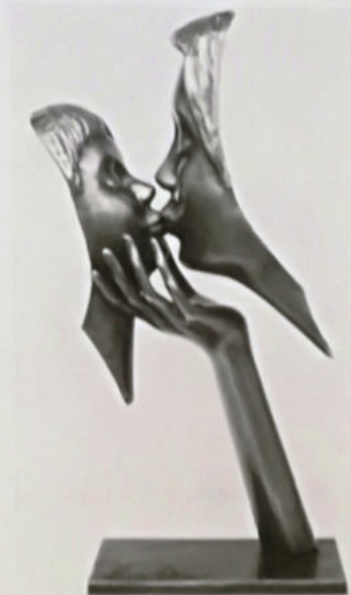
Oliveri, Love, 2016, fusione in bronzo a cera persa h. 105 cm, € 21.000/A