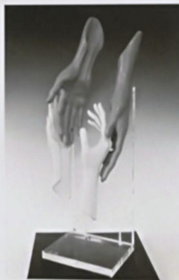
Oliveri, Con amore, 2016, terracotta su plexiglas h. 67 cm, € 9.000/A

Periodi: dal 1954 al 1980 classico; quindi figurativo personalizzato, con vuoti-pieni relativi a stati d'animo, atteggiamenti umani che lo identificano e classificano in «la forma solida dell'aria» (P. Levi). Soggetti: danzatrici, figure femminili, coppie, mani stilizzate, musicisti con strumenti vari, cavalli, famiglia; arte sacra in vari soggetti, in bozzetti e realizzazioni in scala naturale per chiese, case parrocchiali, privati. Dal 2012 soggetti Pop Art. Tecniche: modelli in terracotta, gesso, plastilina per arrivare sempre alla fusione in bronzo patinato; per la produzione Pop Art, resina cromata.