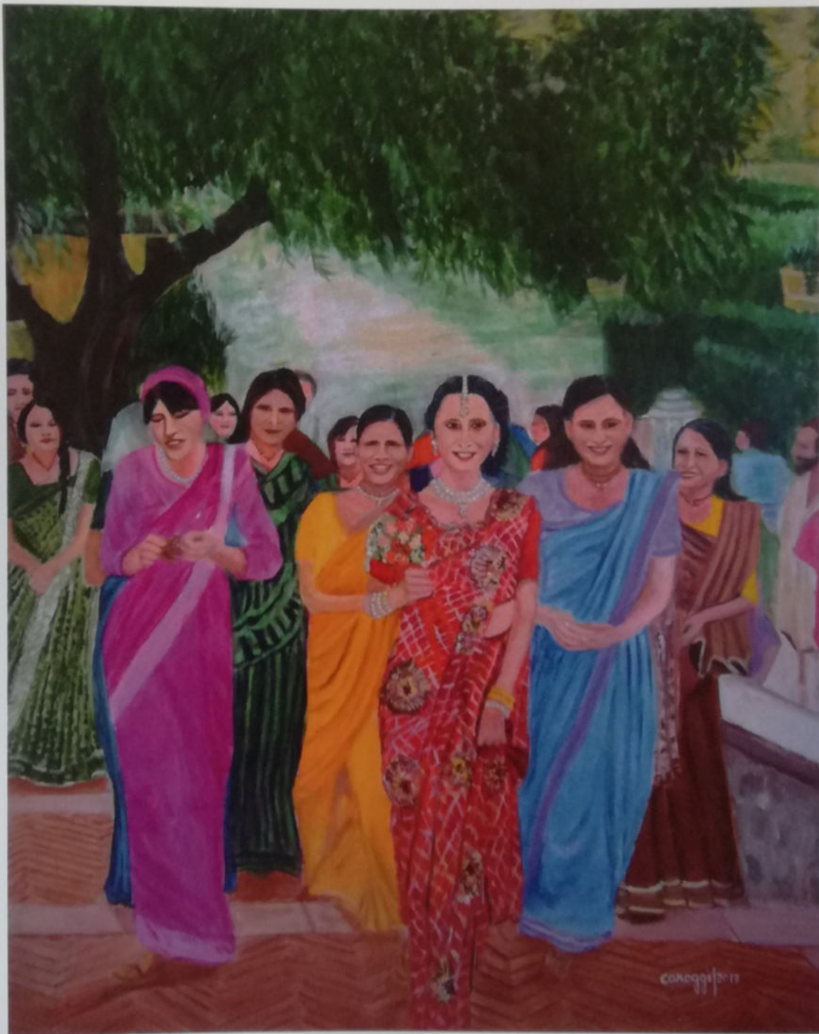
Carmela Oggianu (Caroggi), Sposa Vaisnava che sale al tempio , 2017, acrilico su tela Gallery 80 x 100 cm