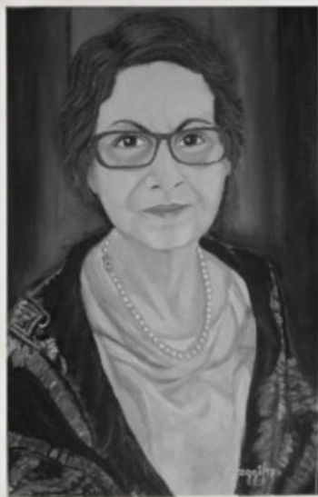
Oggianu, Donna con foulard (Autoritratto), 2017, acrilico su tela 40 x 60 cm, € 700/A

[Vedi tavola a colori fuori testo artista]