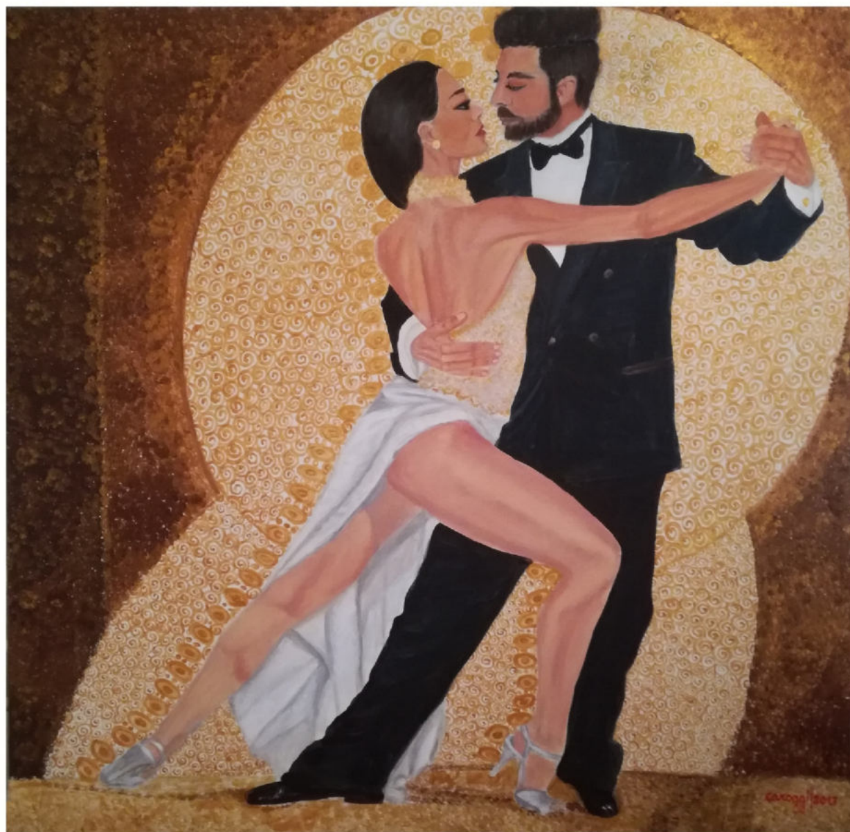
Tango argentino - acrilico su tela - 100x100 cm - 2017

Carmela Oggianu firma dal 1987 i suoi quadri con il pseudonimo artistico di 'Caroggi'. Nata nel 1950 in un piccolo paese della Planargia (Sardegna Nord Centro-occidentale) ha completato gli studi umanistici presso l'Università di Cagliari. È stata docente di Educazione musicale nella scuola pubblica per oltre un trentennio, coltivando in modo parallelo la passione per l'arte, la spiritualità e la filosofia. Man mano ha approfondito le diverse tecniche pittoriche ed è passata per gradi dallo studio dell'acquerello all'olio, prediligendo infine l'acrilico. Opera soprattutto in ambito figurativo trattando vari soggetti (nature morte, figure, paesaggi ...), senza trascurare la cultura e le tradizioni locali.