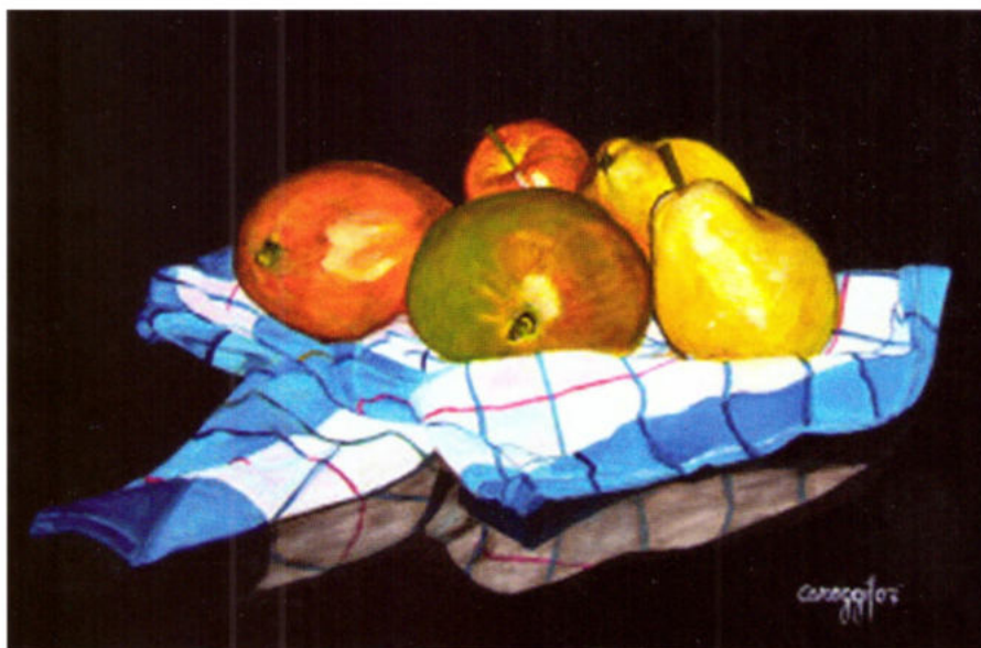
Caroggi Natura morta, 2007 olio su tela, 40x60