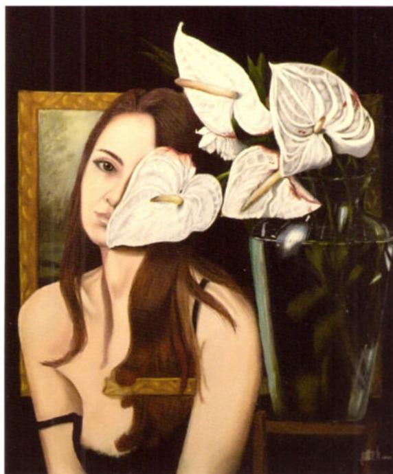
Elisabetta Castello Il risveglio dei sensi, 2016 pastello (softpastel) su carta, 75x65